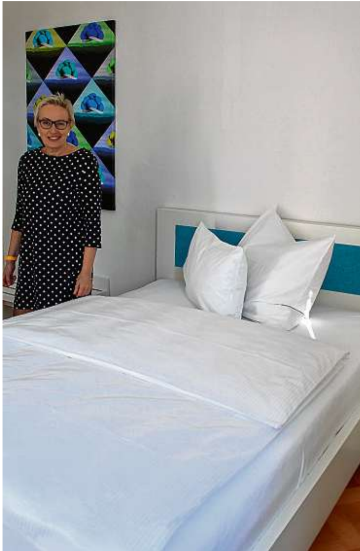
In den weiträumigen Zimmern vereinen sich die klaren Strukturen des Mobiliars mit den historischen Komponenten.