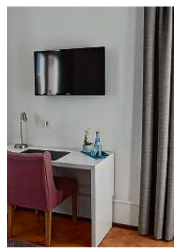
Ein nüchterner Schreibtisch bildet einen Kontrast zum Fußboden.

In den Zimmern steht der Gast auf mehr als 100 Jahre altem Holzboden, nimmt mit jeder Faser die ungewöhnliche Wohlfühlatmosphäre des gelungenen Brückenschlags zwischen ursprünglicher Substanz und Moderne auf, kommt in den klar strukturierten Zimmern zur Ruhe.