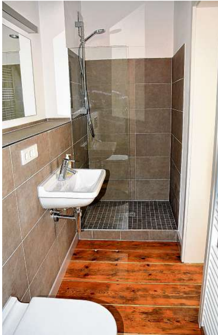
In jedes Zimmer wurde ein Bad eingebaut, in dem gekonnt die Elemente der Bauzeit mit modernster Ausstattung vereint sind.