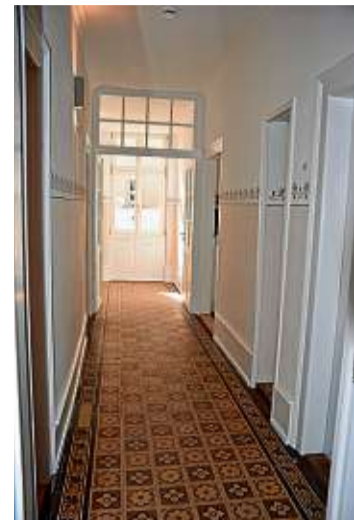
Im Erdgeschoss zeugen die Fliesen vom Glanz des Jahres 1900.

Es knarrt und knarzt gemütlich, wenn man das aufpolierte, von Ornamenten gesäumte Treppenhaus hinaufsteigt.