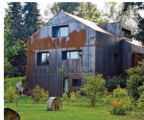
Hinter der außergewöhnlichen Fassade versteckt sich eine 80 Zentimeter dicke Dämmung. Dadurch liegt der Energieverbrauch des Hauses weit unter dem heute üblichen Standard.

Nachhaltigkeit und sorgsamer Umgang mit der Natur stehen auf der Agenda von Andreas Flöß. Er beauftragt vorzugsweise heimische Hand-