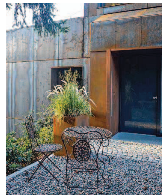
Ein ungewöhnliches Farbenspiel, das sich je nach Wetterlage ändert, kennzeichnet die Fassade.

nach Wetterlage ändert, der weiß, dass ihm dies gelungen ist. Dass der Bauherr bei der Arbeit mit dem Cortenstahl ein gewisses Faible für das Material entwickelt hat, wird deutlich, wenn man die Inneneinrichtung und die Gestaltung der Terrasse betrachtet. Stählerne Korzenständer und Blumentrüge unterstreichen die vorherrschenden klaren Formen.