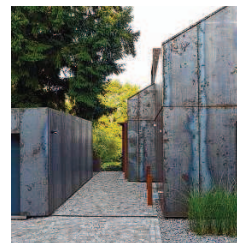
Klare Formen gehen hier den Ton an.

Er sei ein Verfechter einer nachhaltigen Bauplanung. Eine seiner Forderungen lautet, man solle nicht immer neue Baugelände ausschreiben, sondern sich mehr um die Lückensanierung in den einzelnen Gemeinden kümmern.