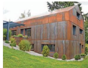
Vorher und nachher: Das Haus am Vogelbeerweg 16 im Villingen Kurgebiet besticht durch seine klare Formgebung. Die ungewöhnliche Umsetzung der Sanierung zieht viele Blicke auf sich.