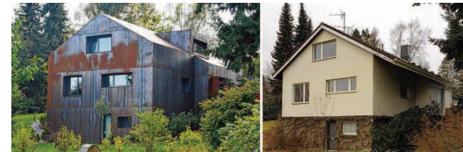
Ein grundsolides und biederes, heute etwas ganz besonderes: Das Einfamilienhaus ist nach der Sanierung zum wahren Blickfang im Villingen Kurgebiet geworden.