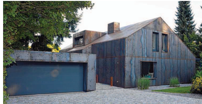
Durch seine eigenwillige Farbgebung fügt sich das Haus am Vogelbeerweg 16 nahezu nahtlos in die grüne Umgebung ein.

Neubauten zum Einsatz - ist ein Material, das sich durch eine unter der Rossschicht liegende besonders dichte Korrosionsschutzschicht auszeichnet. Seine charakteristische Patina bildet sich im Laufe von etwa zwei Jahren und sorgt für einen lang anhaltenden Schutz der Fassade eines Hauses und im Falle dieses Projektes auch des Daches. Denn dem Haus am Vogelbeerweg 16 wurde nicht nur für die Fassade eine durchgehende Schutzschicht aus Cortenstahl verpasst, sondern Andreas Flöß schaffte einen nahezu nahtlosen Übergang bis in das Dach des Hauses. Durch die vorgebaute Fassade und eine dadurch mögliche Dämmung von 80 Zentimetern wurde der Energieverbrauch des Hauses weit unter den heute üblichen Standard gesenkt. Mit einem jährlichen Verbrauch von nur 1,5 Liter Heizöl pro Quadratmeter Wohn- und Nutzfläche liegt man auf einem nur selten erreichten Niveau. Selbst das Dach weist eine 80 Zentimeter starke Dämmung auf. Sommers