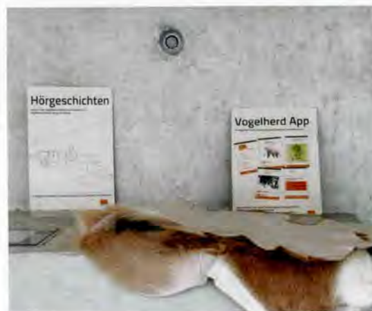
11 Die Veröffentlichung ist kostenfrei über das Landesamt für Denkmalpflege erhältlich.

auch die Verlagerung von Dienststellen in andere Gebäude in Betracht gezogen werden sollte. Anders sieht es in öffentlichen Anlagen und Gebäuden aus, die hauptsächlich in der Freizeit besucht werden. Hier muss das gemeinsame Bestreben darin liegen, eine weitgehende physische Zugänglichkeit zu schaffen und für nicht denkmalverträglich barrierefrei zu erschießende Bereiche eine andere Form der Denkmalvermittlung zu finden (Abb. 10).