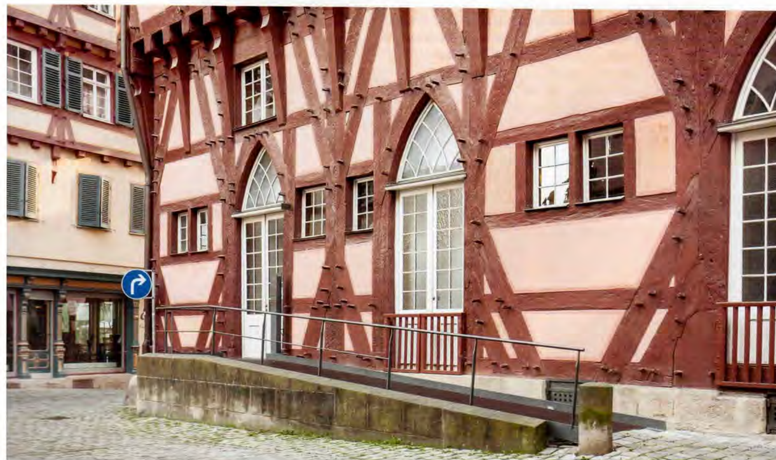
6 Ein positives Beispiel für eine tatsächlich barrierefreie Rampe findet man in Esslingen. Ausgestattet mit Anprallschutz und Handlauf, erschließt sie barrierefrei das Alte Rathaus und hält dabei das vorgeschriebene maximale Gefälle von sechs Prozent ein.

7 und 8 Auf der abschließenden Podiumsdiskussion sprach sich der Vertreter der Architektenkammer Baden-Württemberg (AKBW) Matthias Grzimek (Mitte) für eine verstärkte Aufnahme des Themas „Barrierefreies Bauen“ in den Architekturstudiengängen aus. Zugleich verwies er auf die zahlreichen Fortbildungen des Instituts für Fortbildungen der AKBW. Gebärdensprachdolmetscher übersetzten die Redebeiträge und die Podiumsdiskussion für gehörlose Menschen.