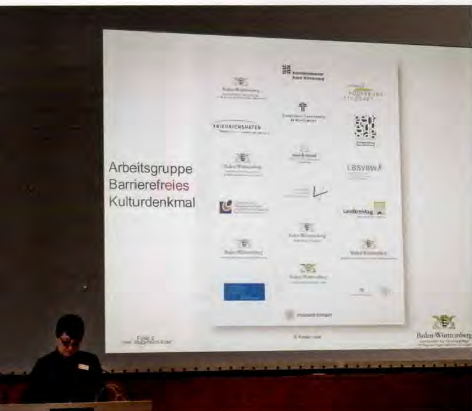
3 Ulrike Roggenbuck-Azad führte für das Landesamt für Denkmalpflege in die Praxisbeispiele ein und hob hervor, wie wichtig für das Arbeitsergebnis und die künftige Zusammenarbeit der direkte Austausch in der eingesetzten interdisziplinären Arbeitsgruppe war und sein wird.

Sensibilität im Umgang mit den jeweils betroffenen Menschen bei der Vermittlung der fachlichen Anliegen abverlangen. Auch wenn für Denkmalpfleger das Finden von Lösungen für den Einzelfall zum Alltag gehört, stellt die Berücksichtigung der vielfältigen Belange der Menschen mit Behinderung eine besondere Herausforderung dar. Insofern stellte die Verknüpfung der oben genannten Themen und der Auftrag zur Erarbeitung eines gemeinsamen Planungsleitfadens eine große inhaltliche Herausforderung dar, die durch das bewusste Miteinander der Gruppenmitglieder bewältigt werden konnte (Abb. 3).