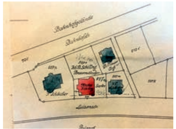
Abb. 5: Lageplan mit Bebauung im Bereich der Luisenstraße/Bahnhofstraße.

In der Abb. 5 sieht man die ursprünglichen Lageplanfiguren der einzelnen Gebäude nebst deren Besitzer. Das Grundstück Luisenstraße 4, ganz links mit der Flurstücks Nr. 507K wurde ab 1903 von Leopold Häring bebaut. Links daneben das Haus des Herrn Schleicher/Werner und in rot eingefärbt ein weiteres des Kronenbrauereibesitzers Schilling. Im hinteren Bereich an der Bahnhofstraße angrenzend, das Gebäude des Chefarztes Maier, welcher im Villingen Friedrichskrankenhaus praktizierte.