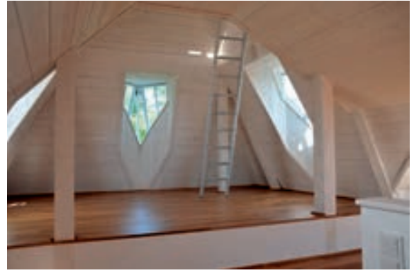
Abb. 15: Dachgeschoss mit Trapezgaupenfenster und Leiter in das Turmzimmer.