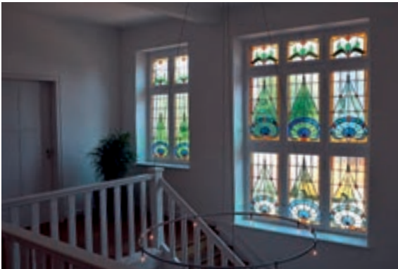
Abb. 18: Treppenhaus mit Bleiverglasten Fenstern.

bauen, dass drei Wohn- bzw. Gewerbeeinheiten im Haus separat zu erreichen sind. Der immer noch großzügig wirkende Aufgang strahlt jetzt in puristischem Weiß und bekommt gedämpftes Licht von großen, bleigefassten Jugendstilfenstern, die allerdings aus anderen, alten Häusern stammen. Sie wurden von Hand gefertigt und für den neuen Einbau in die Luisenstraße restauriert. Auch der Eingangsbereich des Vorbaus, der früher offen war, wurde jetzt mit einer weiß gestrichenen Tür mit passender, aber neuer Holzschnitzerei versehen.