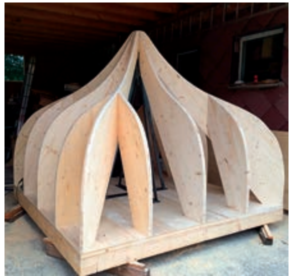
Abb. 11: Fertig abgebundene Turmkuppel mit Grat- und Schiftersparren.