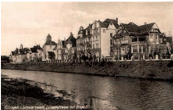
Abb. 3: undatierte Postkarte, Luisenstraße von Süden.