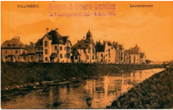
Abb. 2: Luisenstraße von Westen, 3. Haus v. li. ist die Luisenstraße 4.

Wohnturm. Auf der linken Bildseite Richtung Bahnhof, auf dem Gelände der heutigen Hauptpost, standen nochmals zwei ähnliches Villen, direkt an die Luisenstraße 4 angrenzend.