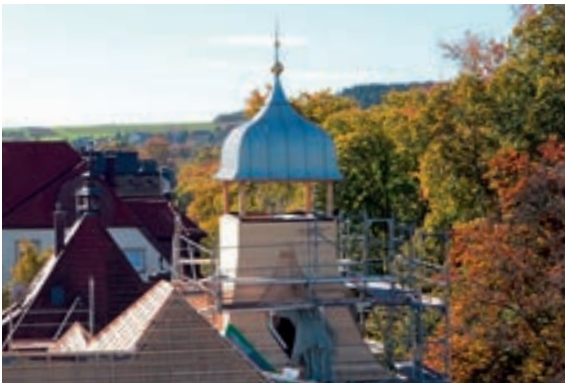
Abb. 14: Montierte Kuppel auf dem Turmschafft und fertig eingelattetes Hauptdach.

Die Spitze des Turmes, von der man dank der Rundumfenster eine großartige Aussicht über die Villinger Innenstadt hat, ist heute wie damals nur über eine Sprossenleiter zu erreichen, die stilgerecht aus Holz erstellt wurde.