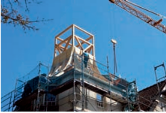
Abb. 12: Aufrichten des Turmschaftea.