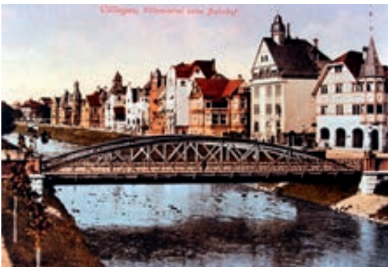
Abb. 4: undatierte Postkarte, Luisenstraße von Süden.

In der Abb. 5 sieht man die ursprünglichen Lageplanfiguren der einzelnen Gebäude nebst deren Besitzer. Das Grundstück Luisenstraße 4, ganz links mit der Flurstücks Nr. 507K wurde ab 1903 von Leopold Häring bebaut. Links daneben das Haus des Herrn Schleicher/Werner und in rot eingefärbt ein weiteres des Kronenbrauereibesitzers Schilling. Im hinteren Bereich an der Bahnhofstraße angrenzend, das Gebäude des Chefarztes Maier, welcher im Villingen Friedrichskrankenhaus praktizierte.