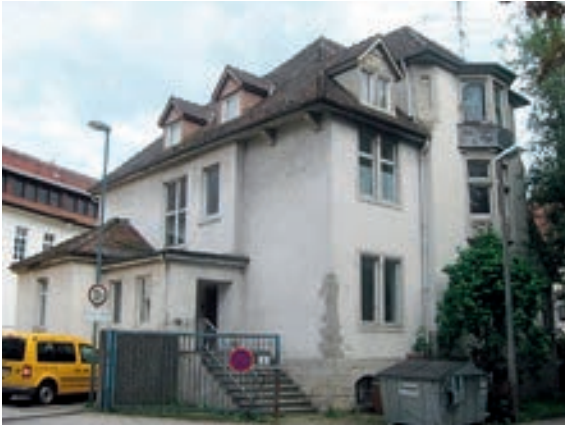
Abb. 8: Gebäudezustand im Jahr 2011 vor der Sanierung und ohne Turm.

in den Urzustand zurückversetzt. Es stellte sich heraus, dass ein wichtiges Merkmal des Gebäudes fehlte: Der Turm, der auf alten Ansichtskarten und Plänen noch zu sehen war, wurde ab 1963/64 vom neuen Eigentümer, der Post, ersatzlos abgebrochen. Abb. 8 zeigt rechts im Bild den noch vorhandenen Erker über die beiden Etagen im Ober- und Dachgeschoss. Das Erkerdach geht ansatzlos in das Hauptdach über, an der Stelle, wo einst der Turm aus dem Dach ragte. Lediglich durch vorhandene Postkarten wurde der Turm nun weitgehend neu rekonstruiert und mit einer 2,80 Meter hohen Spitze versehen. Nur die Turmfenster im unteren Bereich des Turmschaftes wurden neu interpretiert. Gleichzeitig wurden Abstimmungsgespräche mit den Denkmalbehörden in Freiburg und der Stadt Villingen – Schwenningen geführt.