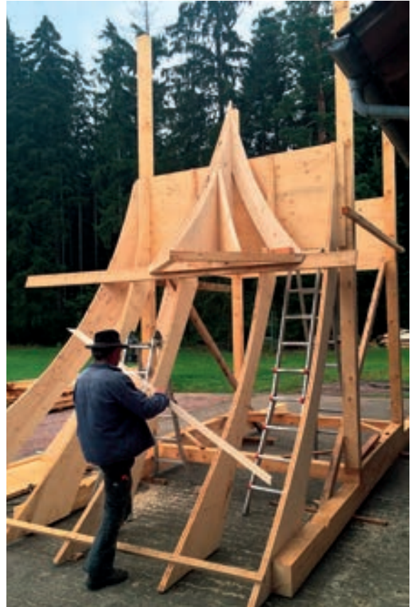
Abb. 10: Abbinden des Turmschaftes mit bereits seitlich ange-bautem Gaupendach.