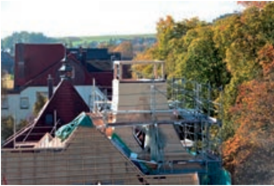
Abb. 13: Turmschaft im Hauptdach noch ohne Turmkuppel.