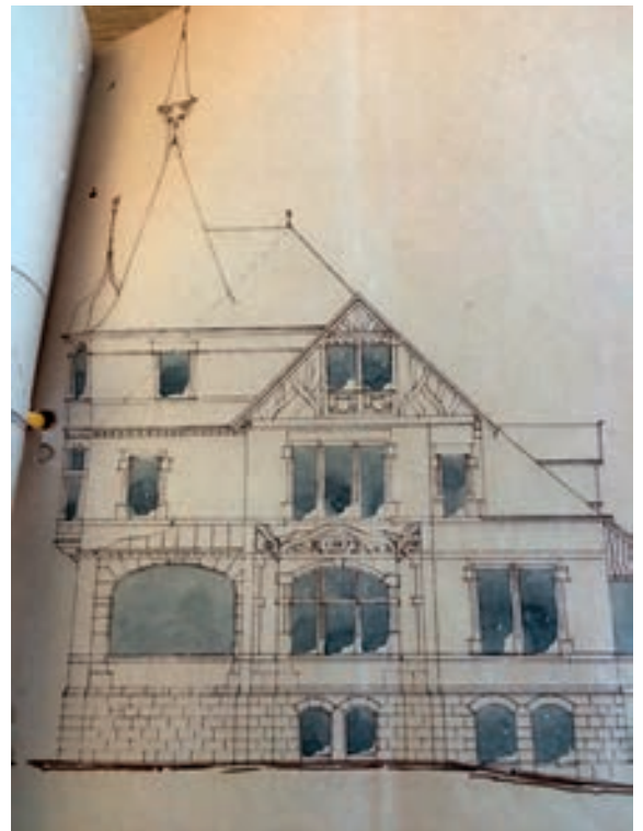
Abb.1: Luisenstraße 4, Genehmigungsplanung von 1903 mit Turmaufbau, welcher so nicht ausgeführt wurde.

Genehmigungsplanung angefügt, welcher dann aber vermutlich im weiteren Bauablauf zu einem massiven Wohnturm um- bzw. ausgebaut wurde. Der in Abb. 1 dargestellte Planauszug aus der Genehmigungsakte von 1903 zeigt einen einfachen Dachspitz mit aufgesetztem Dachreiter und