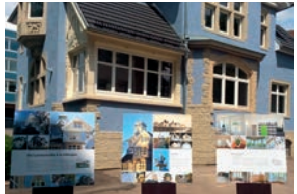
Abb. 20: Präsentationstafeln am Tag der Architektur 2015.

„Gemäß § 2 DSchG liegt seine Erhaltung insbesondere wegen seines dokumentarischen und exemplarischen Wertes, im öffentlichen Interesse.“ 1