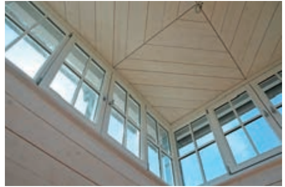
Abb. 16: Blick in das Turmzimmer mit Rautenschalungsdecke.