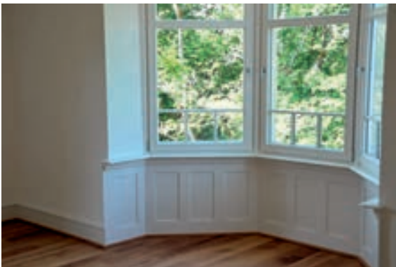
Abb. 19: Detail Fenster mit Brüstungsvertäferung.

Im ganzen Gebäude dominieren nach der Sanierung edle Materialien. Moderne Eichendielen schmücken den Fußboden, neue Holzfenster, ganz nach dem alten Baustil durch filigrane Sprossen unterteilt, und ganz in weiß gehaltene Türen und Fenster strahlen Gediegenheit aus. Viele Bauteile wurden über einen historischen Baustoffhändler bezogen.