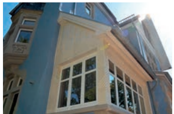
Abb. 17: Holzchnitzereien am Verandaanbau.

Innen war es notwendig, das ehemals herrschaftliche Treppenhaus (im Gegensatz zum immer noch vorhandenen Dienstoffentreppehaus) so umzu-