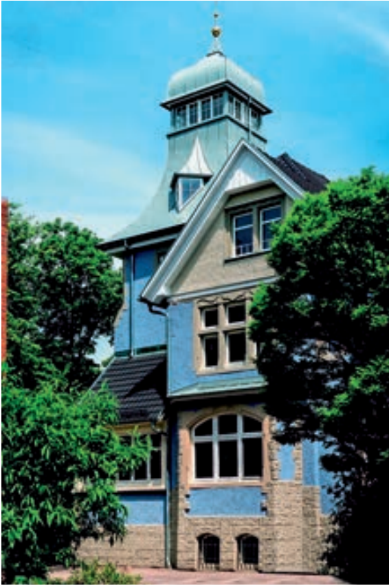
Abb. 21: Gesamtansicht von Süden nach der Fertigstellung.